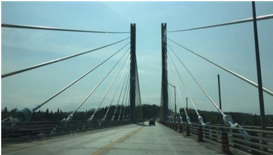
Le pont de la rivière Nipigon. Des questions sans réponse

Ces chiffres n'ont pas été rectifiés lors de l'enquête volontaire auprès des ménages en 2011, les données concernant le taux de chômage ayant été supprimées.